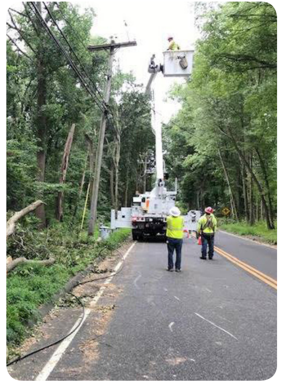
UI crews working to restore power after damage from Tropical Storm Isaias.