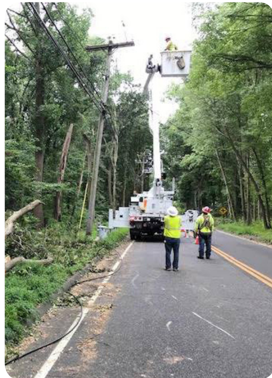
Los equipos de UI trabajan para restaurar la electricidad tras el daño de la tormenta tropical Isaías.